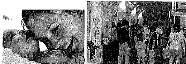
県・KIPの補助を受け、9月、韓国の展示会（アジア・コンテンツ&エンターテイメント産業フェア2010＝写真右）に「Talking Photo（しゃべる写真）＝同左」を出展。写真にある再生ボタンを押すと、約20秒、音声流れる

しゃべる写真「Talking Photo」は、発売して1年半が経過しました。赤ちゃん誕生の記念にと、産科病医院で一定のニーズはありますが、その他への普及にまでは至っていません。しかし、商品のアイデア自体は高く評価されています。KIPのビジネス可能性評価事業の認定を受け、見本市出展支援が受けられることになったので、9月に韓国のACE Fair 2010（アジアのコンテンツ・エンターテイメント産業を集めた展示会）に出展したところ、各国の大臣クラスの方が当社ブースを訪れ、熱心に説明を聞いていただきました。課題はわかっているので、今年中には改良した商品を出したいと考えています。