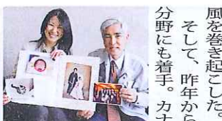
しゃべる写真 2,000円~3,000円

し、グリーンシート市場にも株式を公開している。柔軟な発想力が同社の持ち味。3年前には科学の進歩子どもたちに向けて、理化学研究所との技術協力で「円筒プラネタリウム教材キット・エトワール」を開発。組み立ての簡単さと低価格が話題を呼び、今や全国の教育現場で活用されるヒット商品。パッケージを巻き起こした。