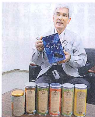
プラネタリウム教材キットエトワールプラス(ミニドーム付) 2,940円 Saje社の有機ハーブティ 2,646円 ※同社のHPテクノショップでも発売中

同社は18年前「世の中にないものを作り出したい」という情熱から起業。幼児教育分野でのソフト・ハーブティを開発を主とした新しいビジネスモデルを展開